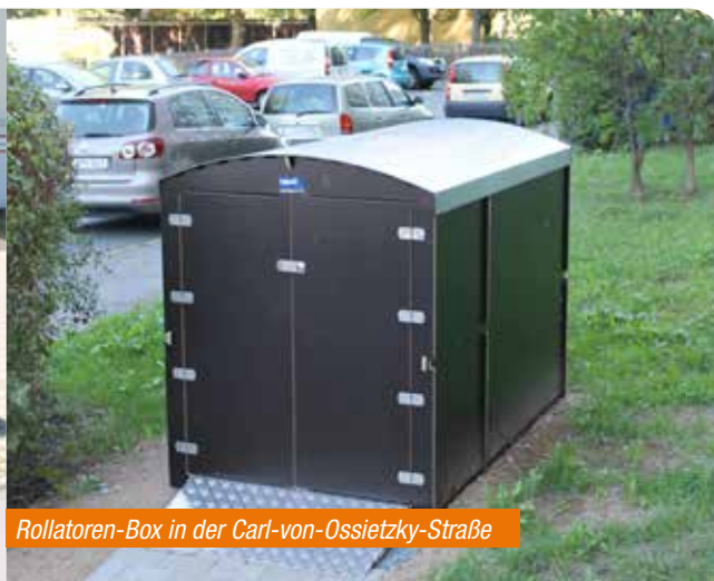
Rollatoren-Box in der Carl-von-Ossietzky-Straße