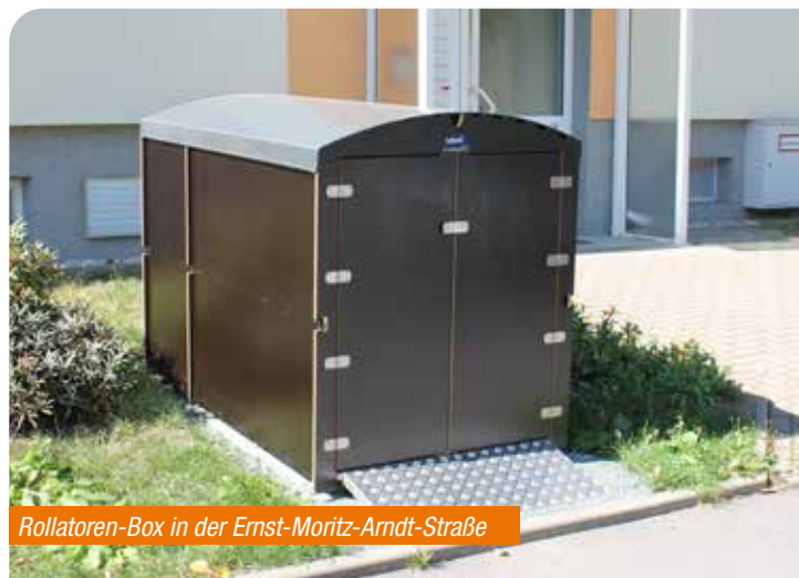
Rollatoren-Box in der Ernst-Moritz-Armdt-Straße